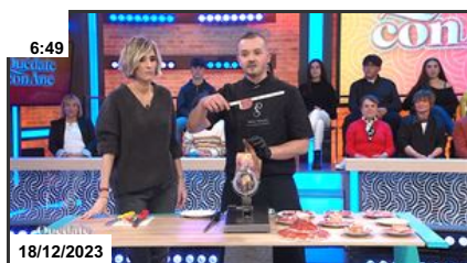
Este es el error más común que cometemos al cortar...