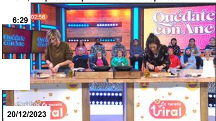
La receta de la "torti-pizza" con tomate, de la...