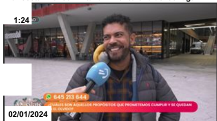
¿Cuáles son los propósitos de año nuevo que menos...