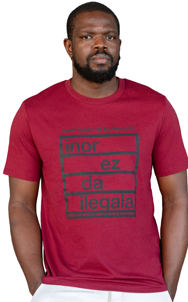
"Inor ez da ilegala" kamiseta organiko granatea 22,00€