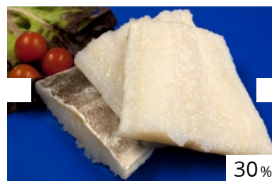
½ kilo de excelente bacalao de anzueto islandés LA KOXKERA